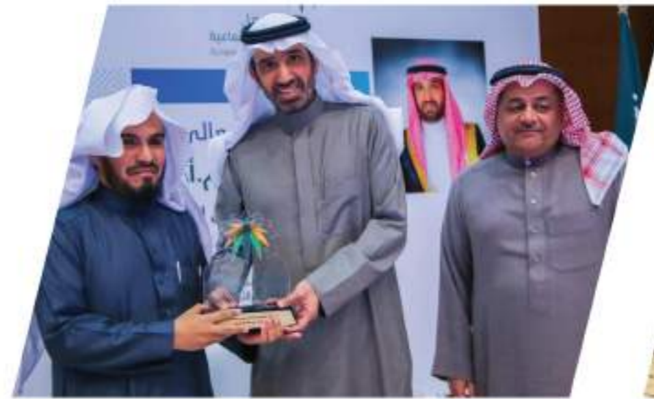
تكريم معالي وزير العمل والتنمية الاجتماعية لعضو مجلس إدارة الجمعية.