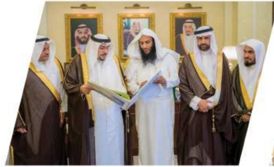
اطلاع سمو أمير المنطقة للتقرير السنوي للجمعية