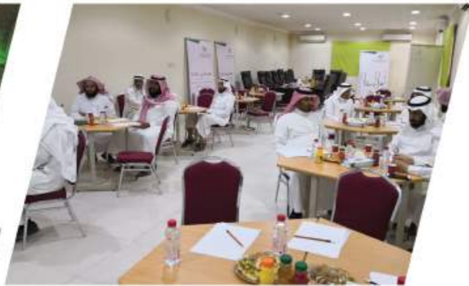
ورشة عمل تحديد احتياجات محافظة البكيرية