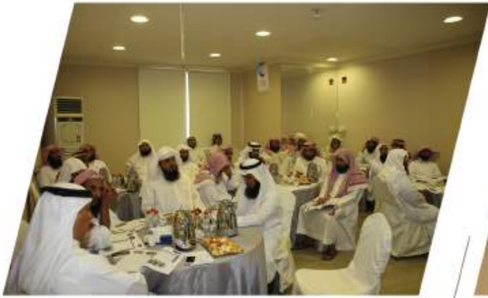
دورة فن إدارة الأفراد