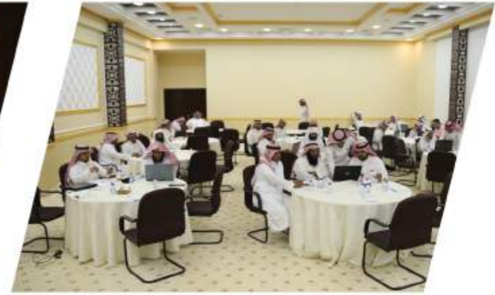
لقاء مديري وحدات التطوع