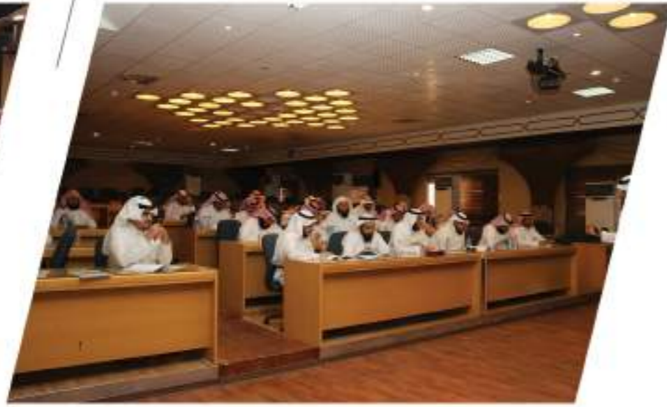
لقاء مبادرة كلنا مبادرون