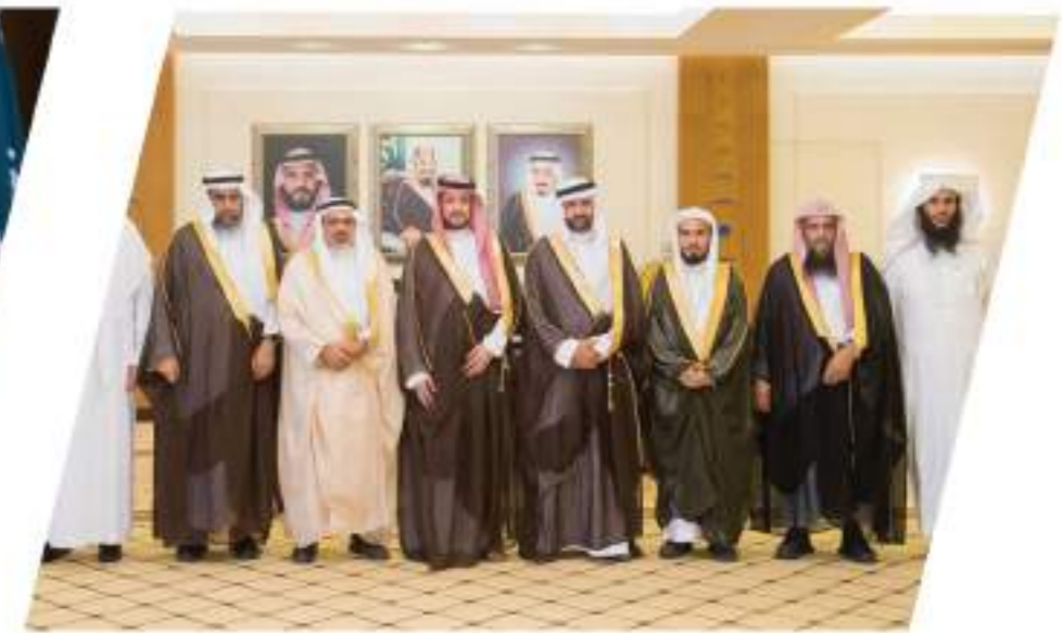
استقبال نائب أمير منطقة القصيم لأعضاء مجلس الإدارة