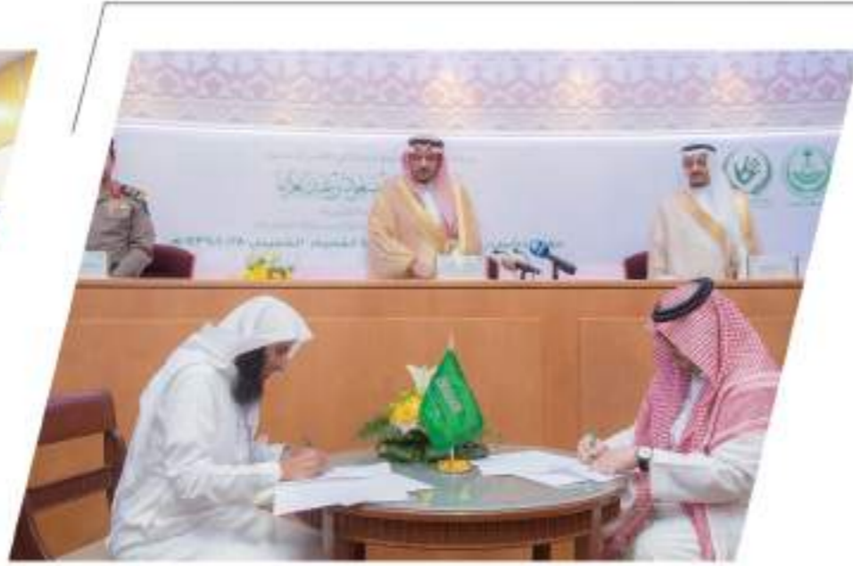
توقيع شراكة رابطة التطوع بين إمارة المنطقة والجمعية