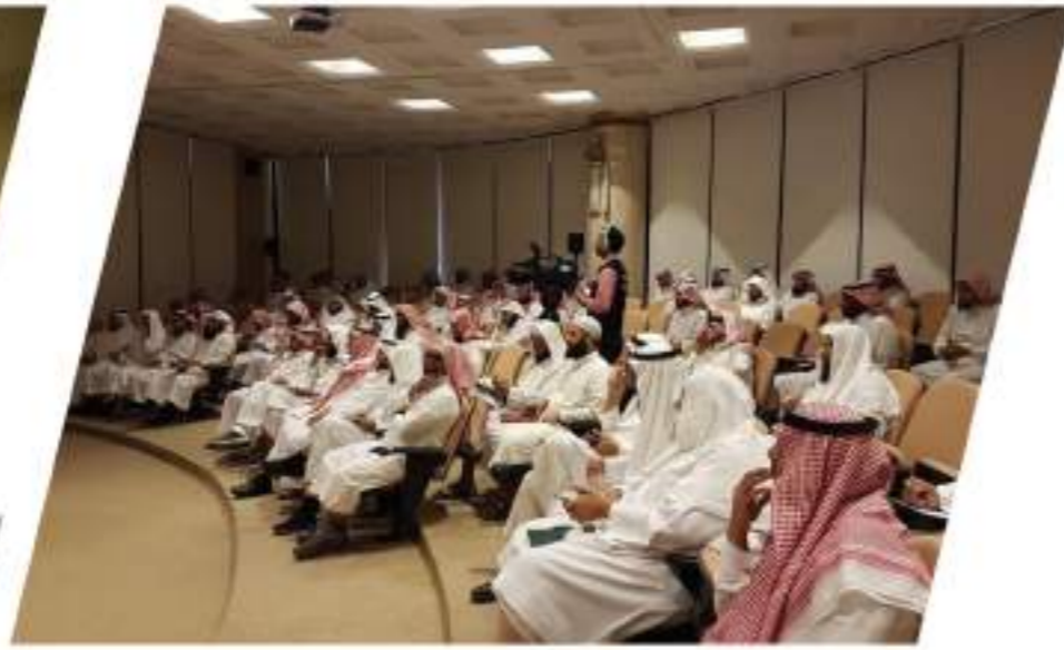
لقاء لماذا تفشل المنظمات غير ربحية؟