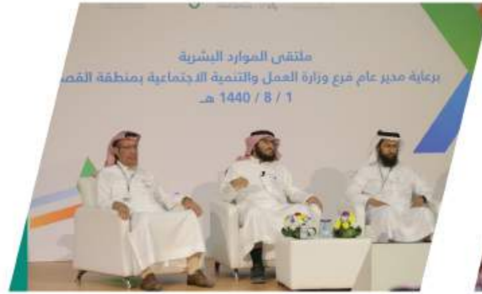
ملتقى الموارد البشرية