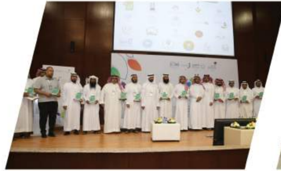
تكريم مديري وحدات التطوع