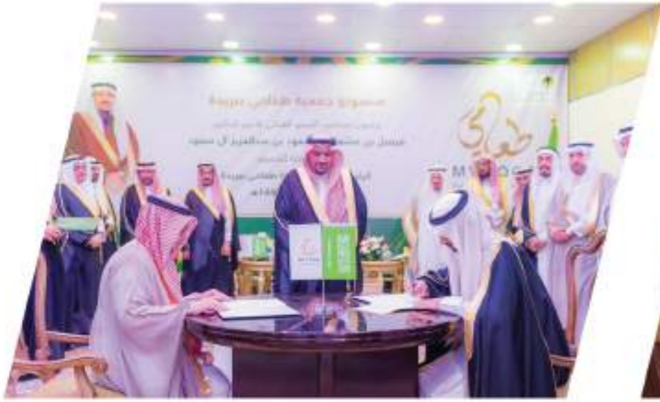
توقيع شراكة بين الجمعية وجمعية طعامي على شرف سمو أمير منطقة القصيم