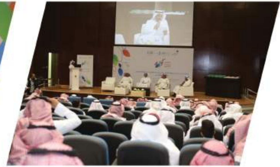
ملتقى استدامة التطوع