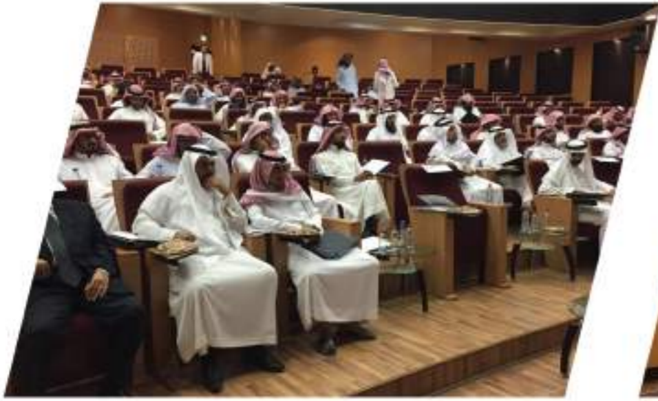
تدشين مشروع خبراء الجودة