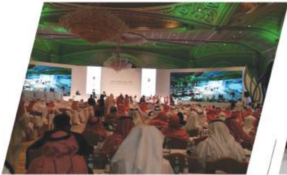
مشاركة الجمعية في منتدى تطوير القطاع غير الربحي بالرياض