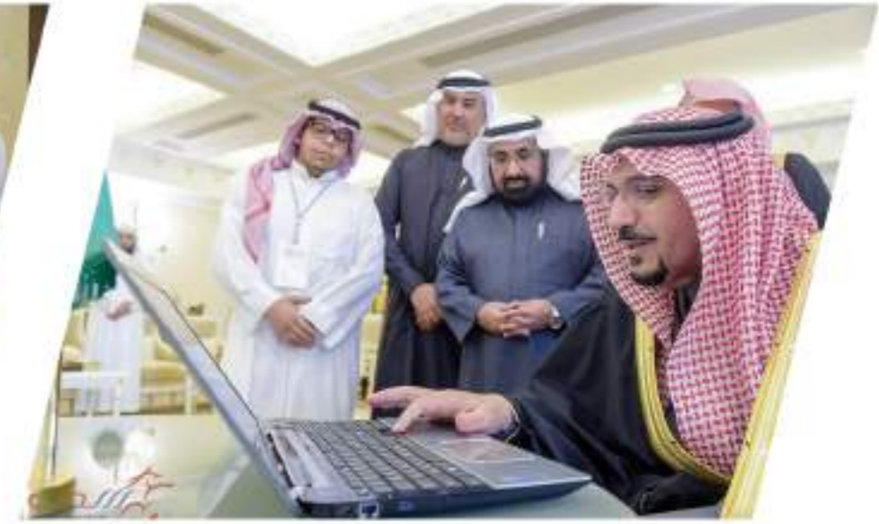
سمو أمير منطقة القصيم يدشين بوابة باذل