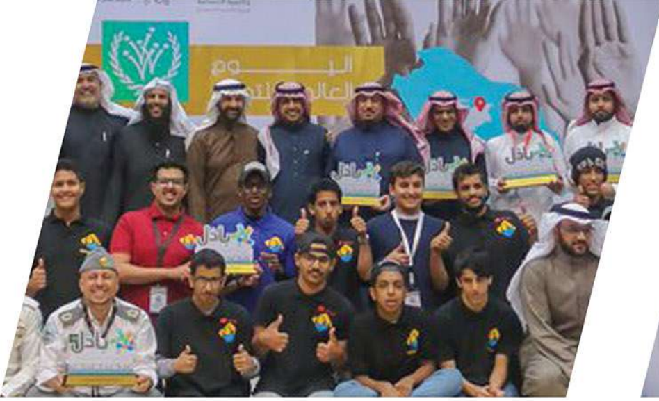
مسابقة باذل 2019