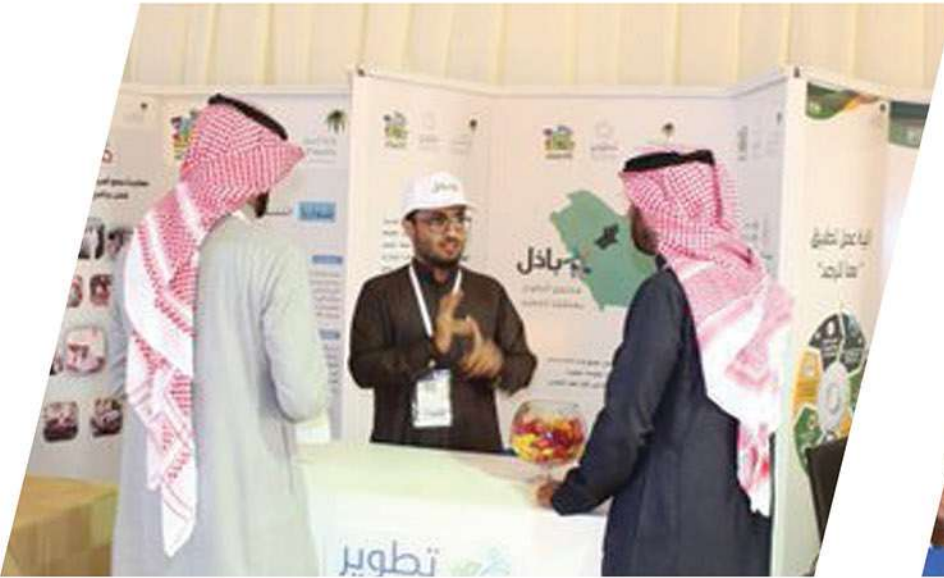
مشاركة جمعية تطوير في مهرجان ربيع بريدة 1441هـ.