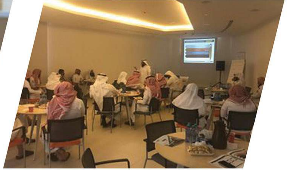
مشروع تمكين القيادات الرجالي