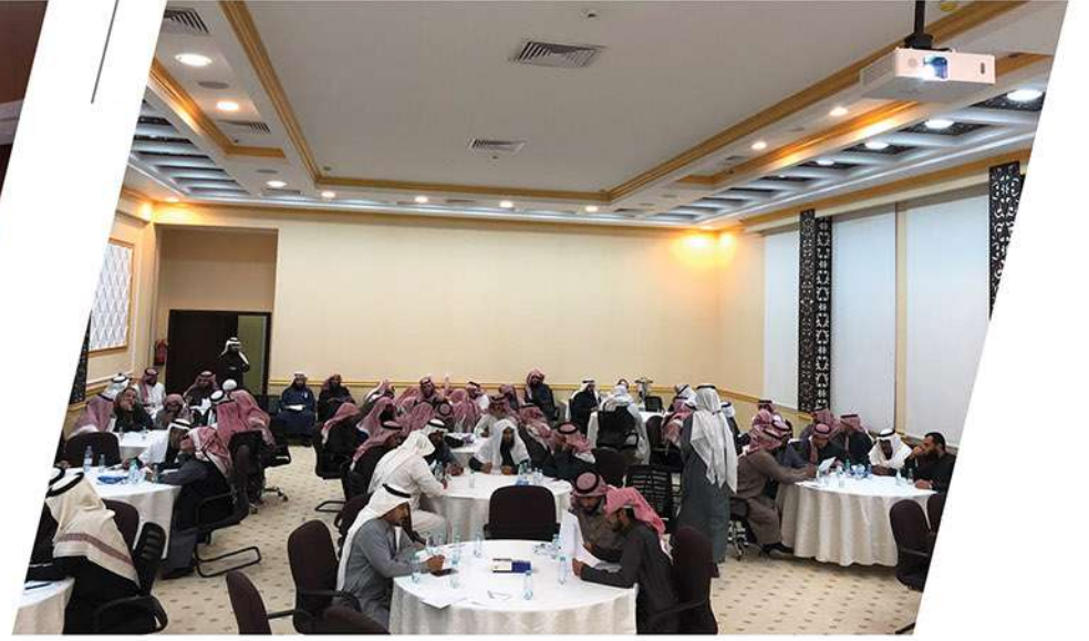
ملتقى أولويات مشاريع الدعم الخيري بمنطقة القصيم