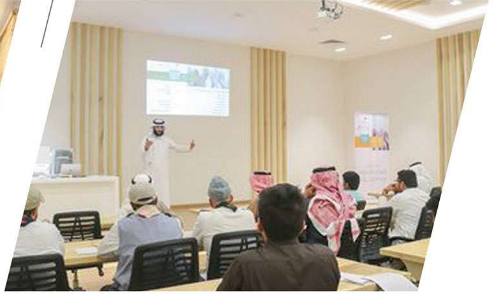
ورشة عمل الفرق التطوعية والمتطوعين