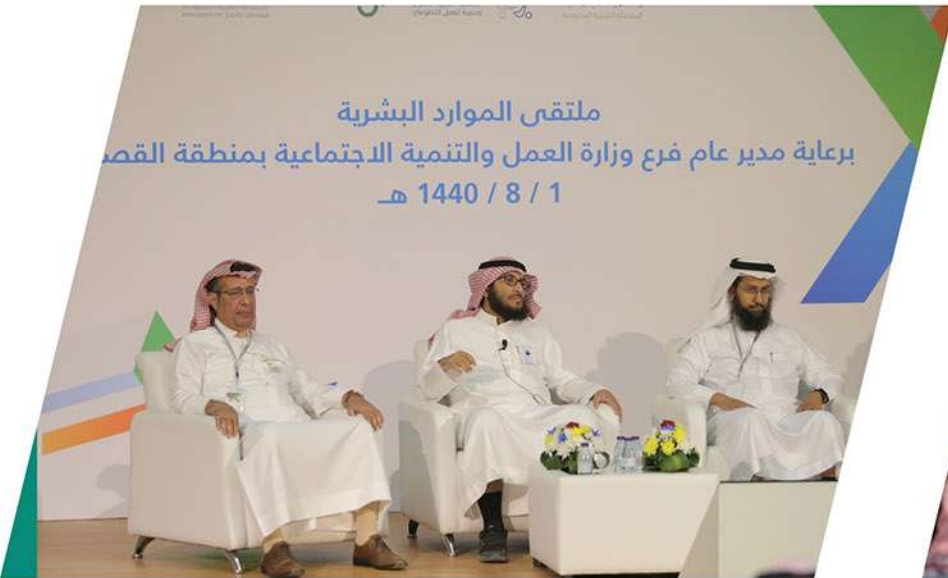
ملتقى الموارد البشرية