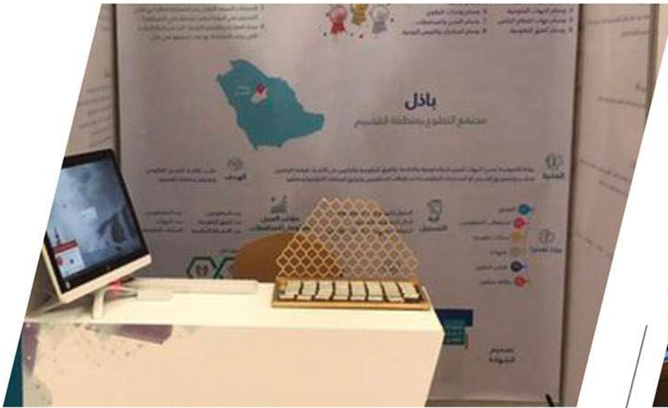
مشاركة الجمعية في المعرض المصاحب للمؤتمر الرابع لمبادرات الشباب العربي