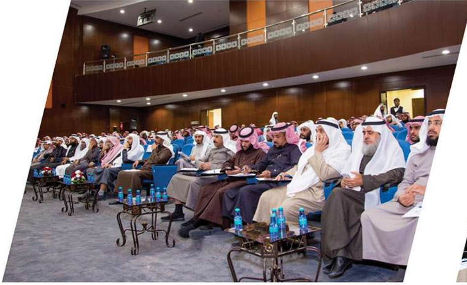
ملتقى أولويات مشاريع الدعم الخيري بمنطقة القصيم