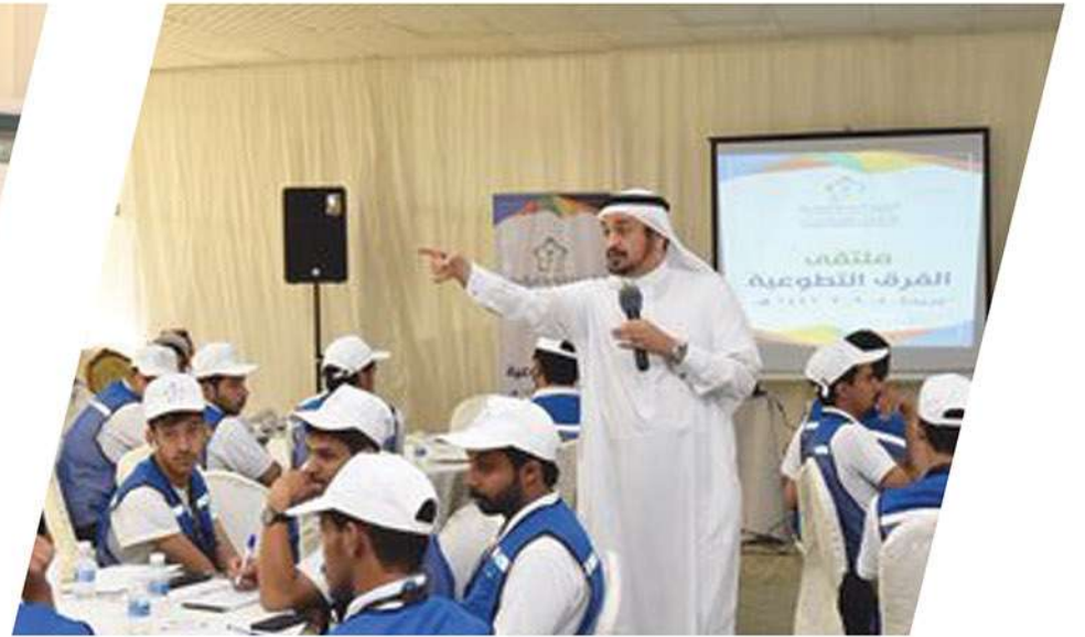
مشاركة الجمعية في ملتقى الفرق التطوعية ببريدة التابع للهيئة العامة للرياضة