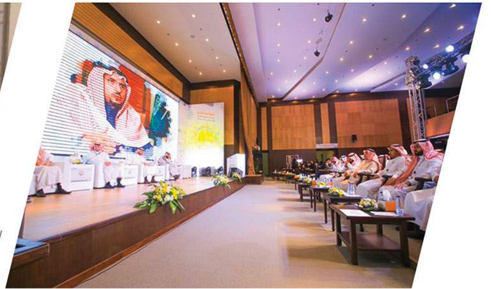
مشاركة الجمعية في المعرض المصاحب للمؤتمر الرابع لمبادرات الشباب العربي