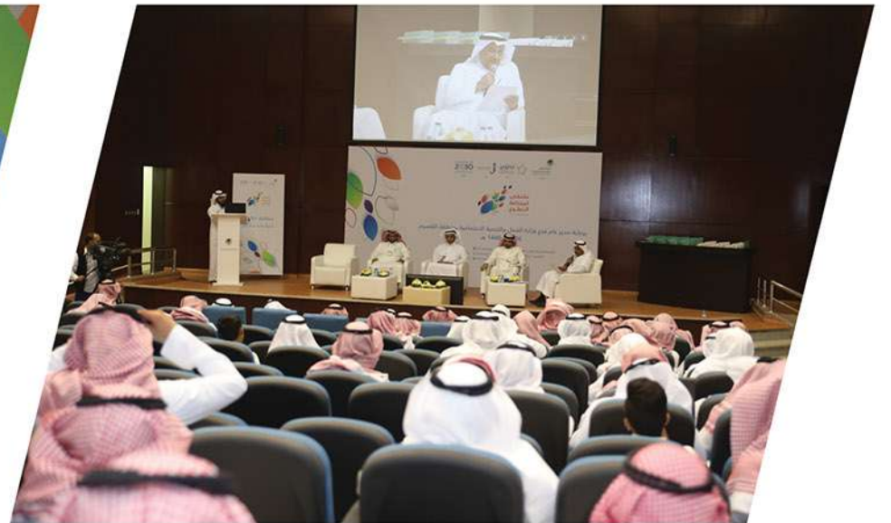
ملتقى استدامة التطوع