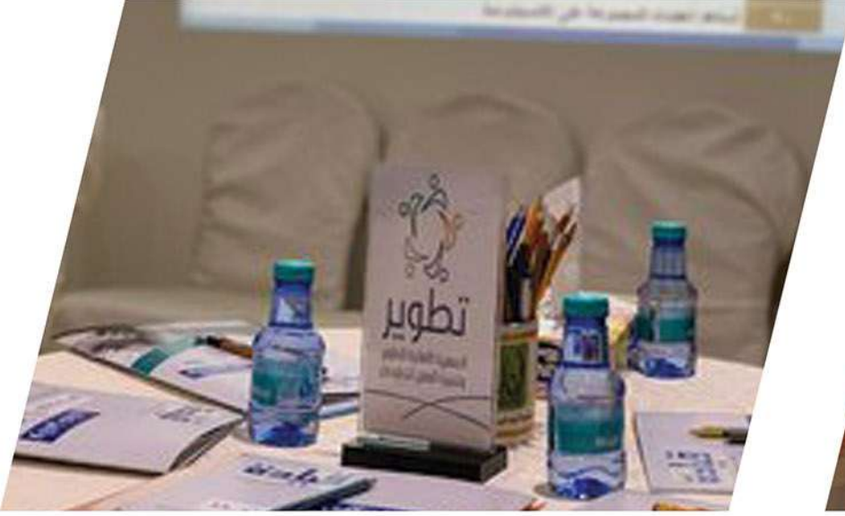
مشروع تمكين القيادات النسائي