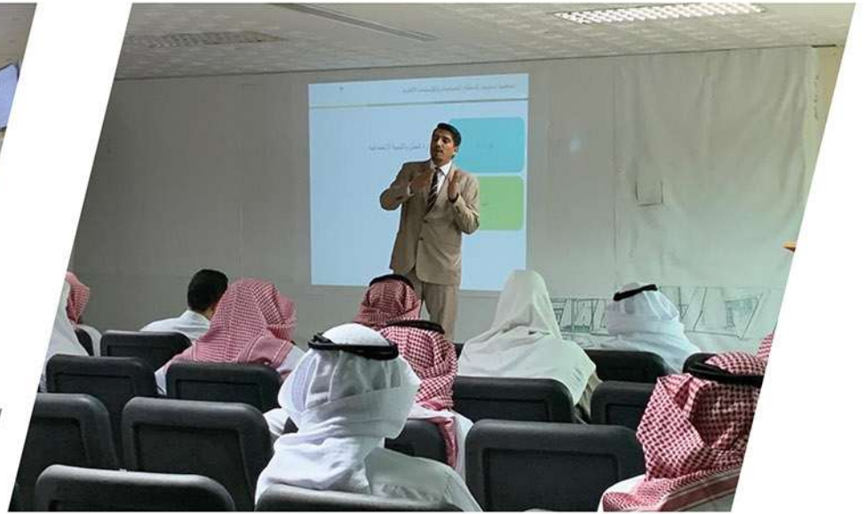
مشروع نظام الحوكمة