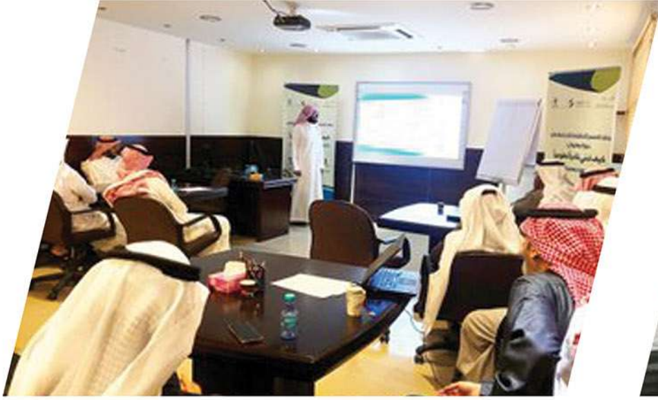
برنامج النوادي التطوعية بالمدارس