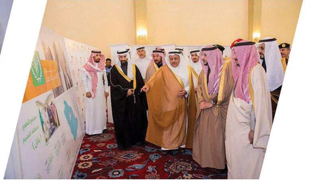
معرض اليوم العالمي للتطوع 2019